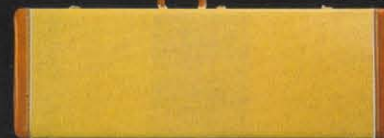
オールド・ケース